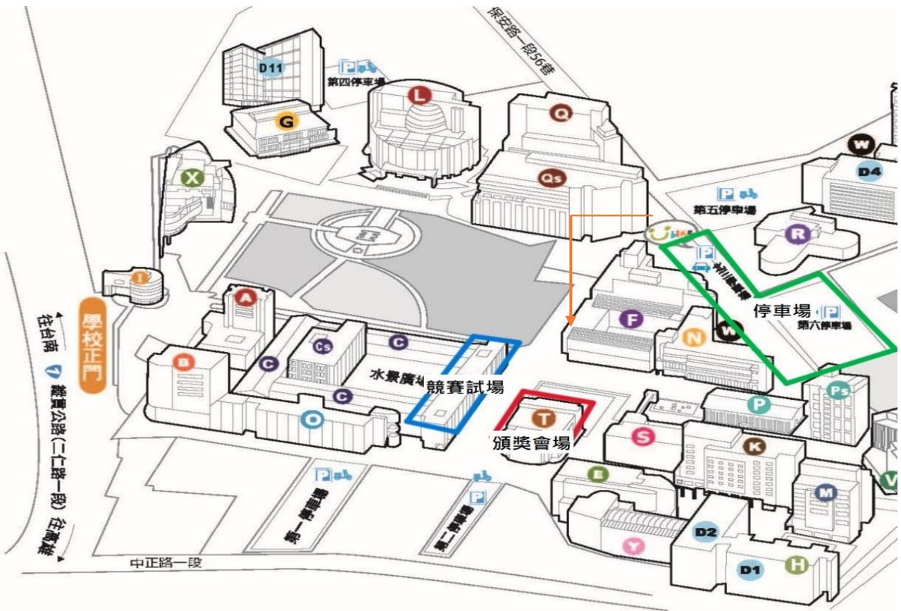
圖1、活動會場動線圖