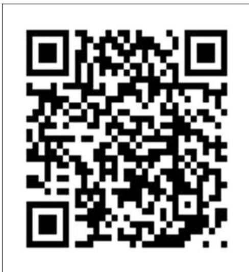
「環境教育友你有我」臉書社團